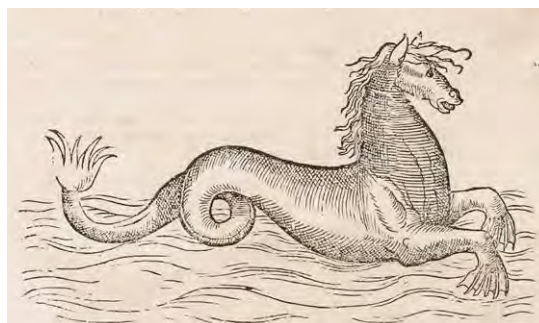
Figura 2. Grabado de un hipocampo que aparece en Historiae animalium: liber IV. Qui est de Piscium & aqutilium animantium natura (1563) [17].

En esta obra se utiliza por primera vez el término hipocampo para describir esta estructura del lóbulo temporal medial [14]. Sus características le recuerdan a un pequeño caballito de mar ( Marinus equulus , género Hippocampus ) o un gusano de seda ( Bombycinus vermis ). Arantius cree que esta estructura se asemeja más a un gusano de seda que a un caballito de mar, pero finalmente se decanta por este último: el término ' hippocampus ' es más corto y simpático que ' Bombycinus vermis '.