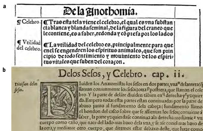
Figura 1. a) Fragmento de Libro de la anatomía del hombre (1551); b) Fragmento de Historia de la composición del cuerpo humano (1556).

parte de la médula. Y Rufo de Éfeso, en el siglo I d. de C., indica que existen diferentes clases de médula, distinguiendo, por ejemplo, entre la espinal y la que hay dentro del cráneo (es decir, el cerebro). El castellano actual no es ajeno a estas analogías. La Real Academia Española acepta el uso de la palabra ‘meollo’ ( medulla , lat. ‘médula’) como sinónimo de cerebro [1]. En hebreo se utiliza moha para denominar al cerebro, a la grasa y a la médula. Lo mismo sucede con la palabra árabe muj , si bien en esta lengua también se utiliza al-dimag para designar la masa contenida dentro del cráneo [2].